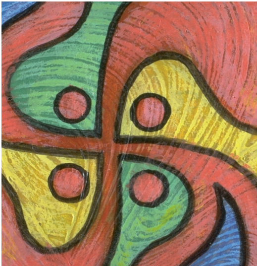
MedioThek das kostengünstige und ausbaufähige Programm für Mediotheken, Schulen und Institute.

MedioThek WebLink bringt Ihre Bibliothek ins Internet. Mit den angeschlossenen Geräte können Sie mit dem Webbrowser in der MedioThek suchen. Dabei werden drei Grundtechnologien zur Auswahl angeboten: IWP, WebD und PHP.