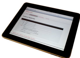
Suche auf dem iPad mit Webbrowser oder FileMaker Go

Die PHP-Lösung wird auf einem FileMaker Server installiert. Einige zusätzliche PHP-Dokumente werden im Webordner abgelegt. Der WebServer greift darauf zu und nimmt Kontakt mit der Datenbank auf.